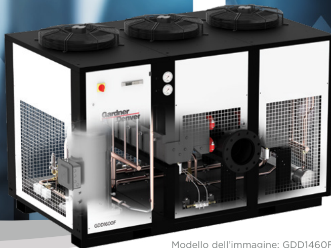
Modello dell'immagine: GDD1460F