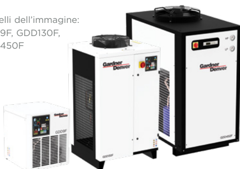
Modelli dell'immagine: GDD9F, GDD130F, GDD450F

La valvola di scarico elettronica programmabile è una funzionalità di serie (fino al modello GDD80F), che può essere regolata totalmente per ridurre al minimo le perdite d'aria.