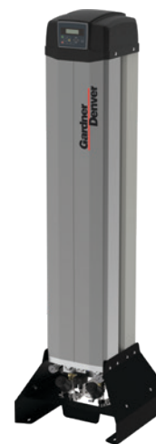
Serie da GDX7M -70 °C a GDX50M -70 °C Portata da 0,67 m 3 /min