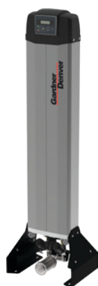
Serie da DS GDX7M -40 °C a GDX50M -40 °C Portata da 0,67 m 3 /min